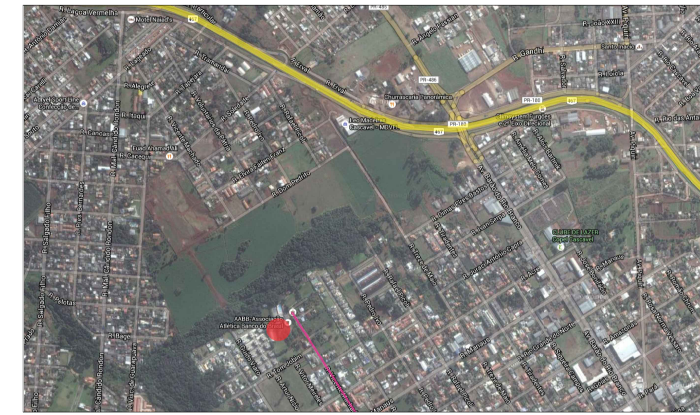
ABB Cascavel Rua Vicente Machado BR-167